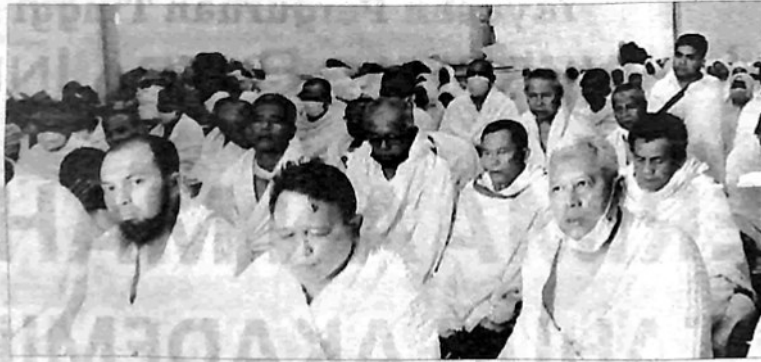
ROMBONGAN jamaah haji asal Kota Padangpanjang ketika melaksanakan rangkaian haji.